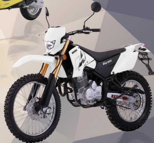
BEHRO GY 200